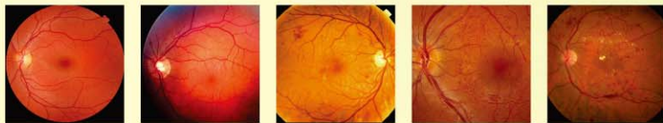
0級：沒有糖尿病視網膜病變 1級：糖尿病視網膜病變 1級：糖尿病視網膜病變 2級糖尿病視網膜病變 2級糖尿病視網膜病變

為了提供就診病人更好的醫療品質，眼科部主任蔡宜佑醫師帶領視網膜科主任陳文祿醫師、林正明主治醫師等專業眼科專家和長佳智能合作研發出眼科糖尿病視網膜病變判讀系統，讓病人在接受眼底鏡影像檢查後能夠及時判讀是否有糖尿病視網膜病變的情形；除此之外，目前也努力在針對視網膜病變做更詳細的疾病分級，同時加入青光眼，白內障等眼部問題，期望未來可以建立一套國際級的眼科判讀標準，能輔助醫師診斷大多數常見的眼部疾病，同時將系統應用在非眼科專業部門，協助如家醫科等臨床醫師做更精準的診斷。