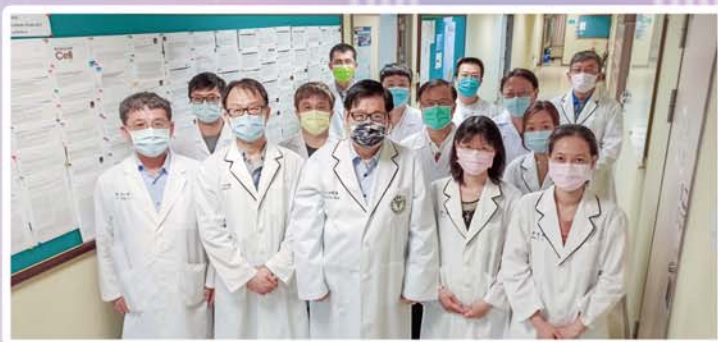
洪明奇校長帶領的抗新冠科研團隊

中國醫藥大學校長洪明奇院士帶領抗新冠研究團隊，透過科技部「COVID-19之標靶藥物開發」計畫經費支援以及中研院提供病毒模型協助下，運用新組建之分子細胞快篩平台，在中華藥典與天然物中，開發對抗英國和南非變種病毒的抑制劑。